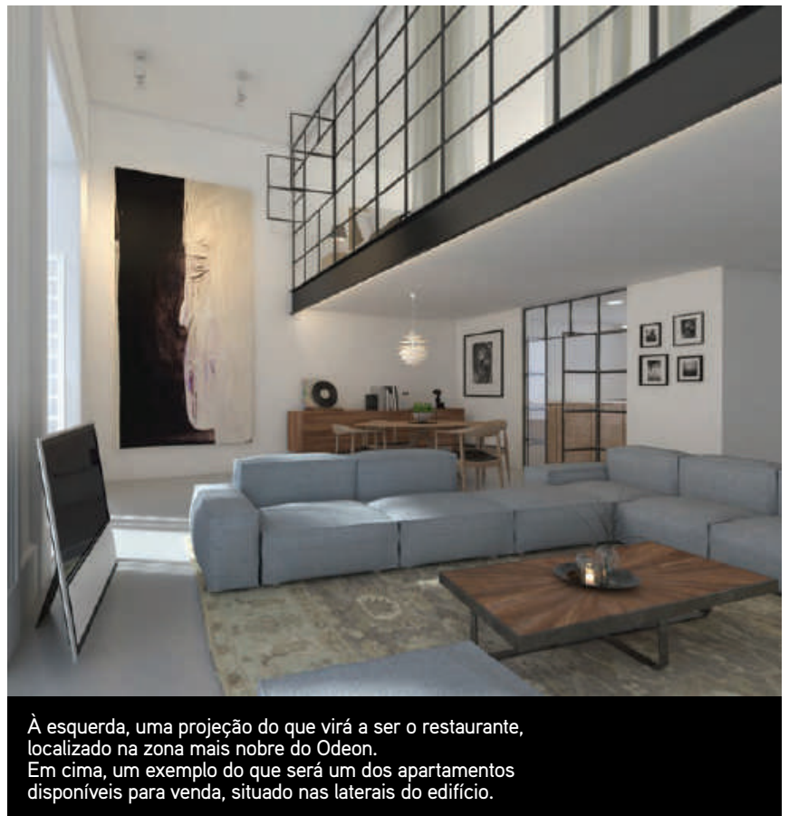
À esquerda, uma projeção do que virá a ser o restaurante, localizado na zona mais nobre do Odeon. Em cima, um exemplo do que será um dos apartamentos disponíveis para venda, situado nas laterais do edifício.