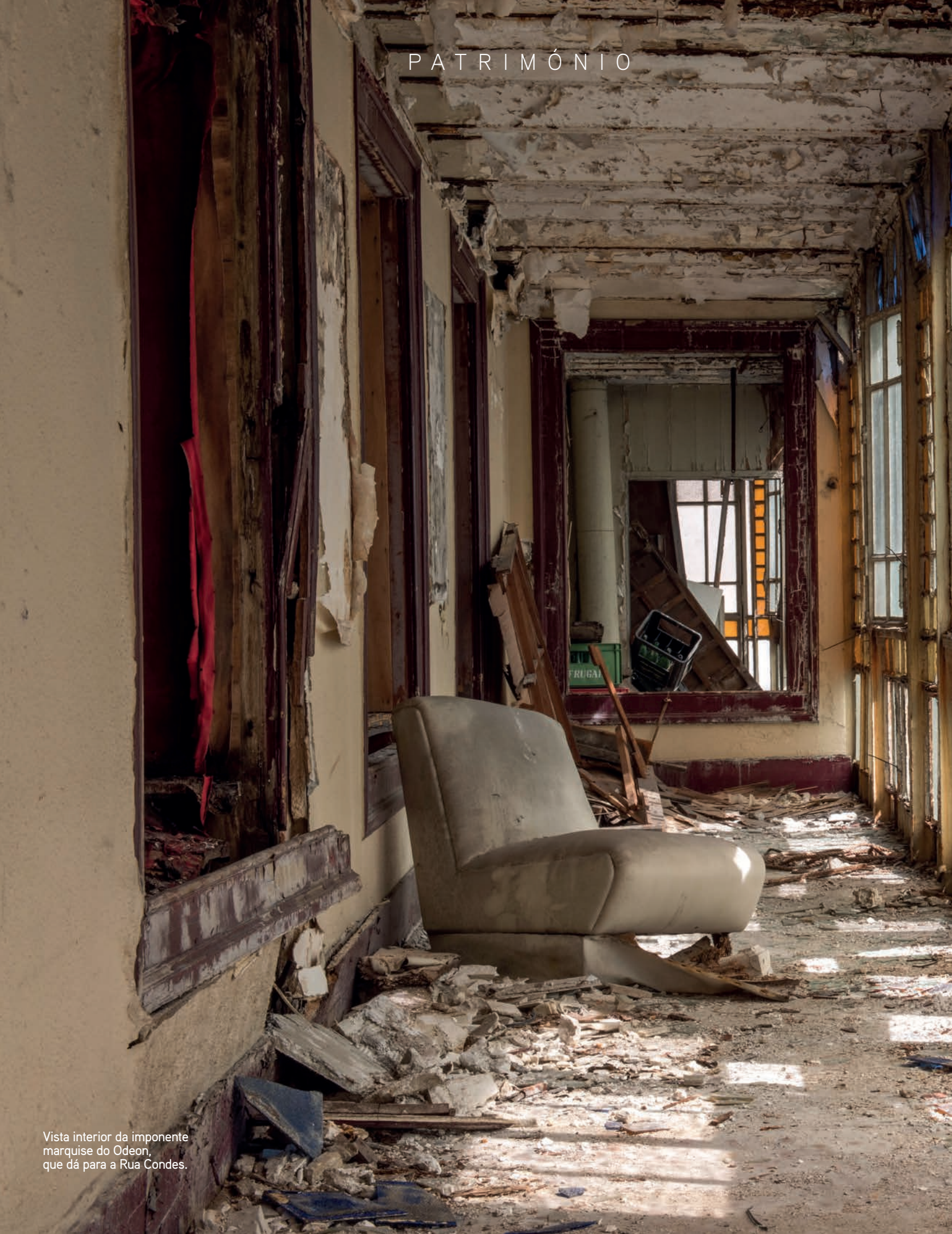
Vista interior da imponente marquise do Odeon, que dá para a Rua Condes.